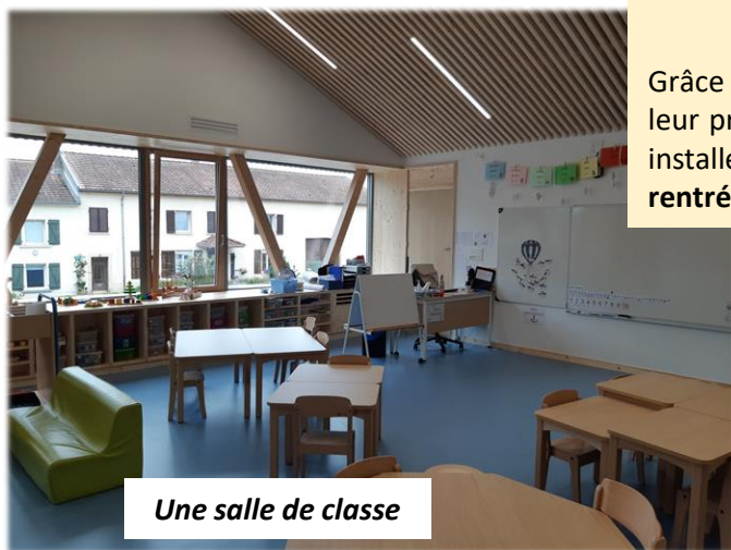
Une salle de classe