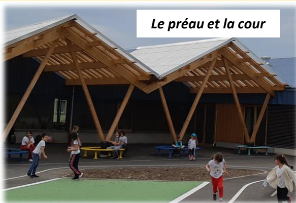
Le préau et la cour

Grâce aux enseignantes et aux nombreux bénévoles venus leur prêter main forte, le mobilier et les fournitures ont été installés dans la nouvelle école le week-end précédant la rentrée scolaire .