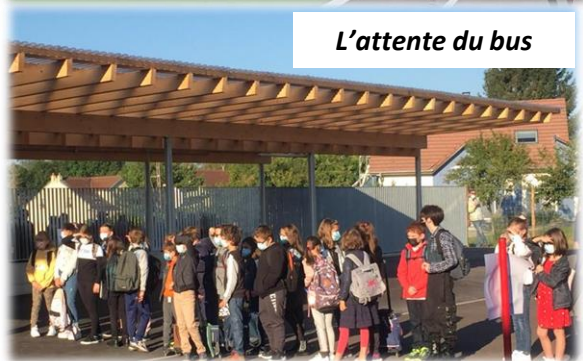
L'attente du bus